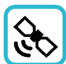
Komunikace & Management