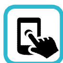
Snadné uživatelské rozhraní